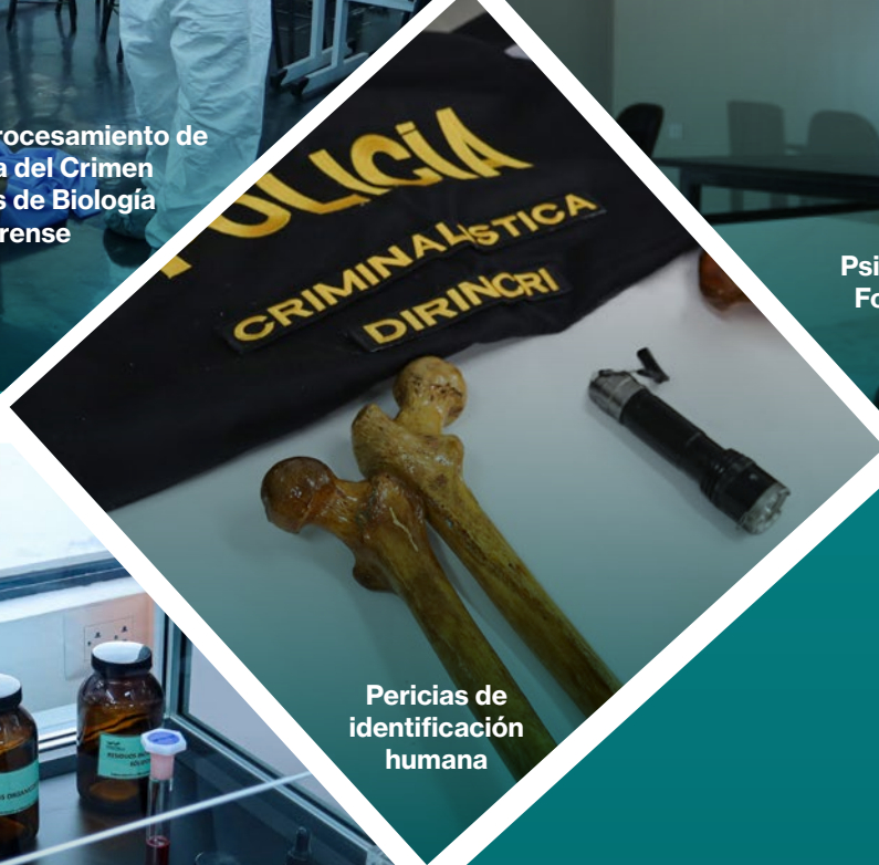
Pericias de identificación humana