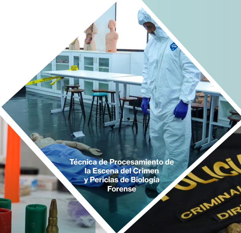
Técnica de Procesamiento de la Escena del Crimen y Pericias de Biología Forense