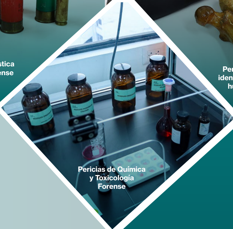
Pericias de Química y Toxicología Forense